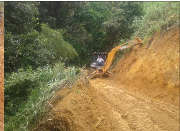
Paso habilitado, vía vereda la Martinica, sector Altamira.