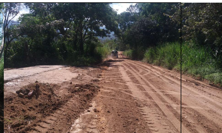
Mejoramiento de la vía hacia la vereda Llanos del Combeima.