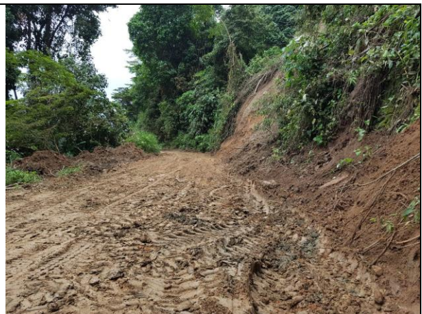
Recuperación vía San Bernardo – San Juan de la China.