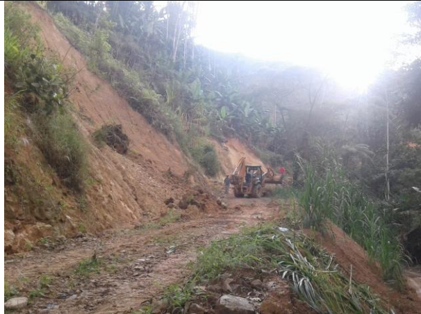
Remoción de deslizamientos vía vereda Potrero Grande Alto.