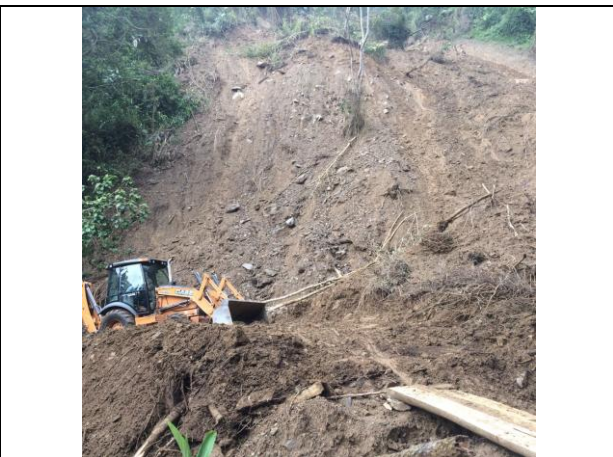
Remoción de deslizamientos vereda el Colegio