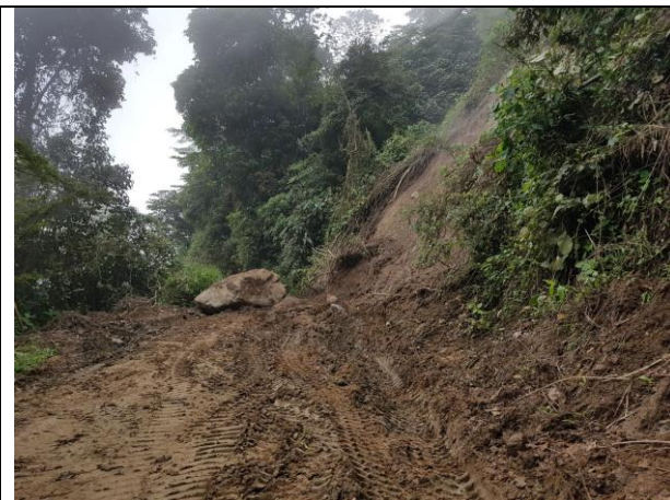
Deslizamiento de rocas y tierra vía San Bernardo – San Juan de la China

De igual manera ha iniciado mantenimiento de vías terciarias para de esta manera poder mejorar la calidad de vida de nuestros campesinos en cuanto a su seguridad, comodidad, reducción de tiempos de desplazamiento y transitabilidad.