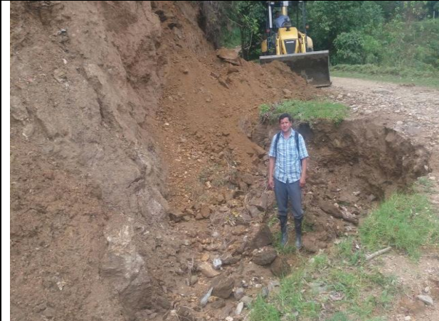
Pérdida de la banca costado derecho vía vereda el Rubí.

SECRETARÍA DE DESARROLLO RURAL Y DEL MEDIO AMBIENTE DESPACHO