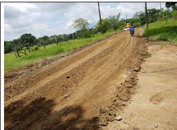
Mejoramiento de la vía entre el barrio el Salado hacia la vereda Carrizales.