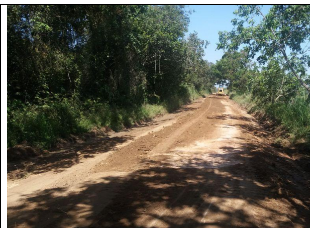
Mejoramiento de la vía hacia la vereda Llanos del Combeima.