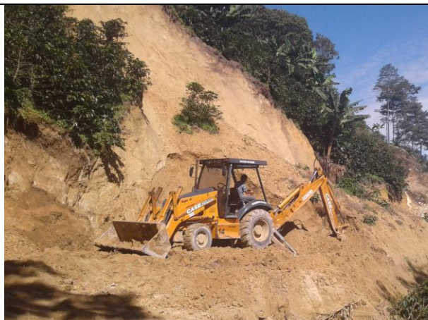
Remoción de deslizamiento en la vía que comunica a la vereda la Florida.