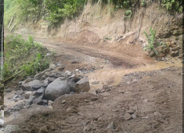
Paso crítico habilitado vereda Santa Bárbara.