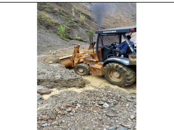
Deslizamiento en la vía que comunica a la vereda Tapias, sector el salón.