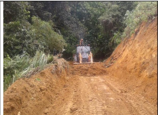
Remoción de deslizamiento vía vereda Martinica, sector Altamira.