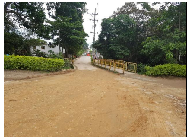
Conformación de la vía hacia la vereda de Carrizales.