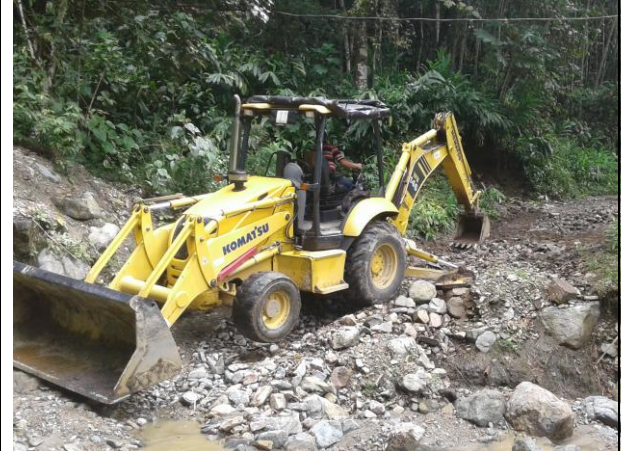
Mejoramiento pasos críticos vereda Santa Bárbara.

SECRETARÍA DE DESARROLLO RURAL Y DEL MEDIO AMBIENTE DESPACHO