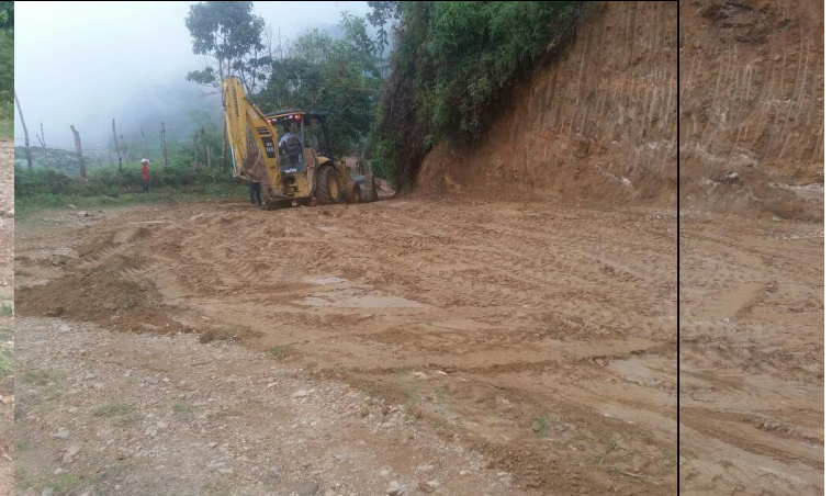
Conformación de la banca vía vereda el Rubí.