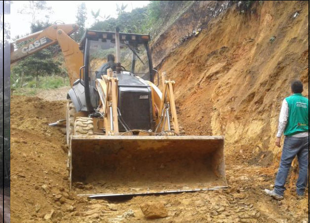
Remoción de deslizamientos vía vereda Potrero Grande Alto.