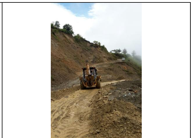
Remoción del deslizamiento en la vía que comunica a la vereda Tapias, sector el salón.