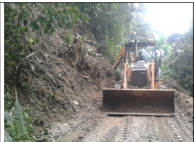
Deslizamiento vía vereda Potrero Grande.