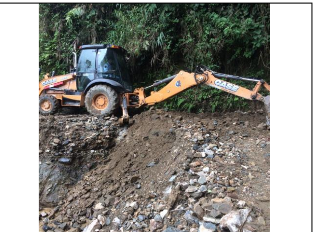
Mejoramiento de pasos vía vereda el Colegio