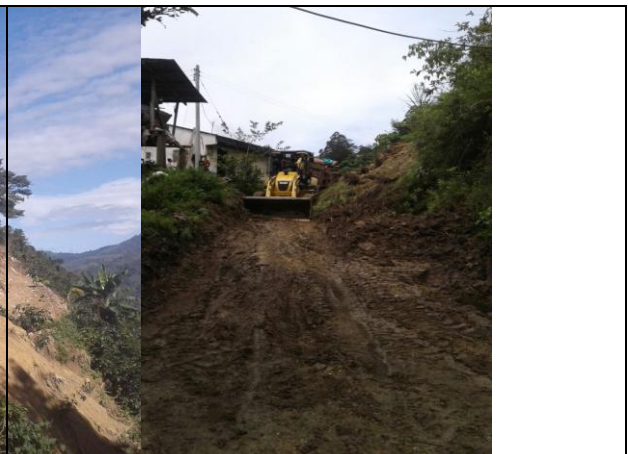
Remoción del deslizamiento en la vía que comunica a las veredas San Juan de la China – La Isabela.