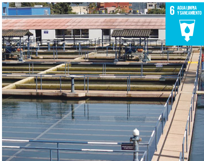
6 AGUA LIMPIA Y SANEAMIENTO

Asimismo, el Alcalde agregó que todo esto será posible con la licitación de la fase II del Acueducto Complementario, ya publicada en el Secop II por más de 24 mil millones de pesos, que incluye la interventoría, y que tiene por objeto la puesta en marcha de esta megaobra que será adjudicada el 3 de junio.