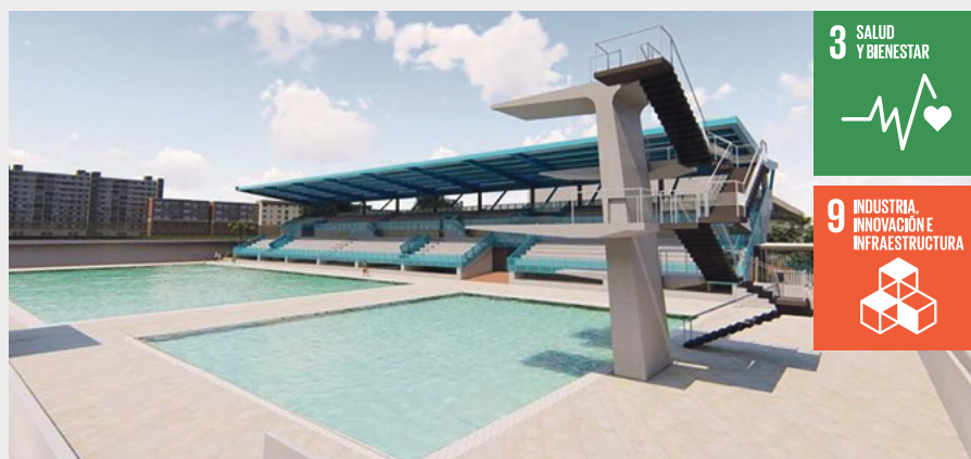
3 SALUD Y BIENESTAR

Con este, ya son cinco los escenarios que construye el gobierno ‘Ibagué Vibra’ en la ciudad, saldando la deuda histórica que administraciones anteriores tenían: Tejódomo, Pista BMX, Coliseo Mayor y el Complejo de Raquetas, además del Coliseo Menor que será ejecutado por la Gobernación del Tolima.