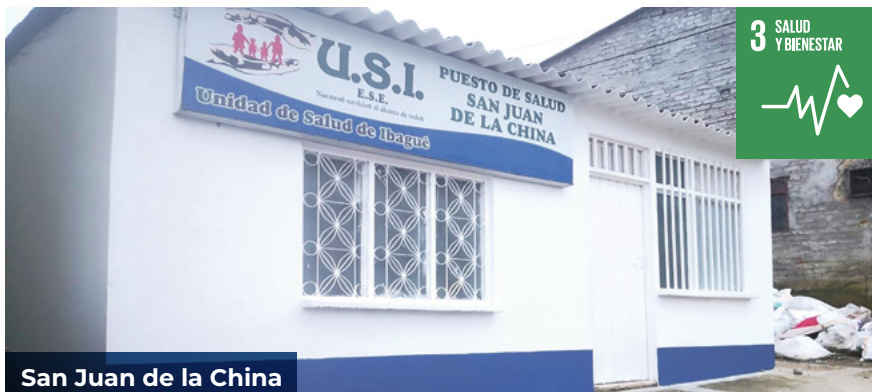
San Juan de la China

Es de resaltar que están en ejecución remodelaciones de otros puestos de salud en Charco Rico, El Totumo y Llano del Combeima.