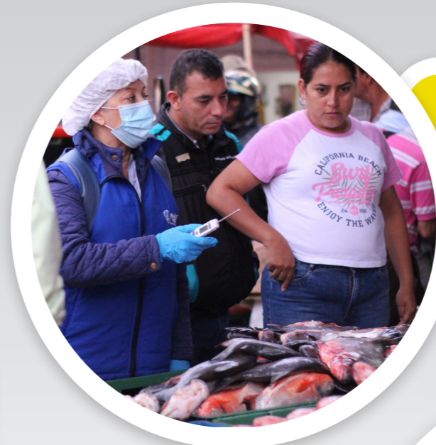
También se inspecciona el adecuado manejo de carnes, el Plan de saneamiento al día y el soporte del plan de saneamiento.