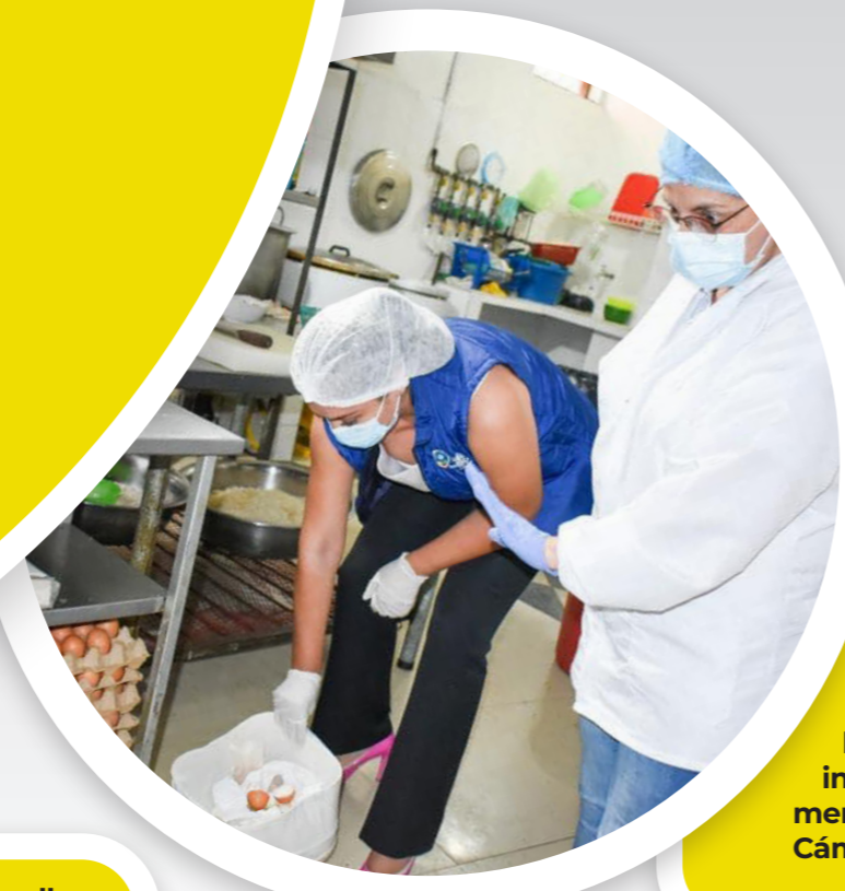
Algunos aspectos que son tenidos en cuenta son el cumplimiento de la norma sanitaria, en la infraestructura, en la indumentaria de todo el personal, Cámara y Comercio al día y control de plagas.