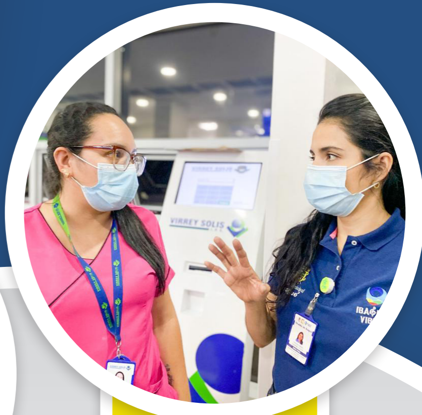
También en las IPS se inspecciona, el cumplimiento en el cuadro de turnos del personal.