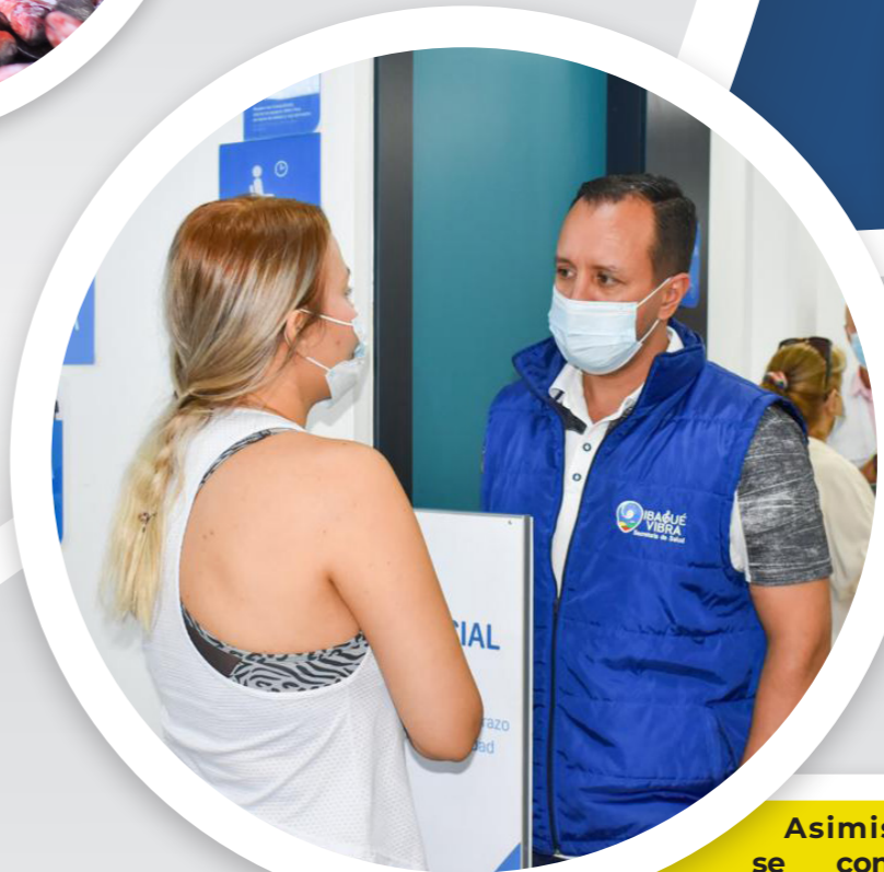
Asimismo, se controla contar con suficiente personal para atender a los usuarios.