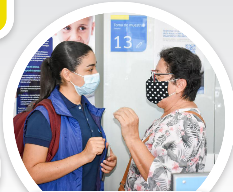
En farmacias: Tiempo de espera, dispensa de medicamentos y priorizar públicos específicos (adultos mayores, mujeres embarazadas y niños).