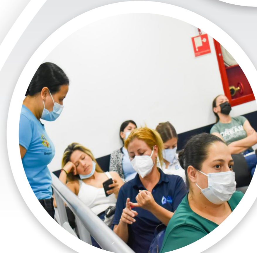
En las IPS se verifica el tiempo de espera para triaje y re valoración.