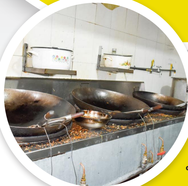
La Administración Municipal ha atendido las denuncias de la comunidad.

El bienestar y la salud en toda la comunidad ha sido una prioridad desde el inicio del gobierno 'Ibagué Vibra'.