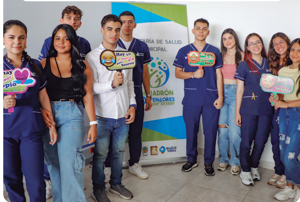
Las autoridades continúan en la lucha para contrarrestar los síntomas de esta enfermedad, por eso la estrategia 'Abraza Tus Emociones', sigue desarrollándose en las instituciones educativas, barrios y entidades de salud.