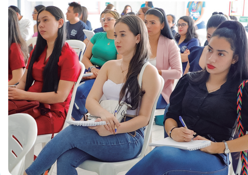
Otra actividad fue la capacitación a más de 50 estudiantes de 5 universidades de la Facultad de Psicología. Ellos fueron partícipes de los cursos en atención integral en salud mental y primeros auxilios psicológicos.