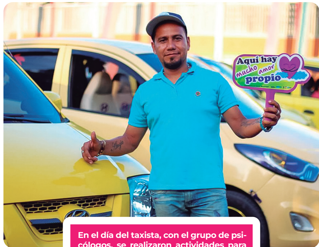
En el día del taxista, con el grupo de psicólogos, se realizaron actividades para conocer las emociones y se brindaron tips para gestionarlas.