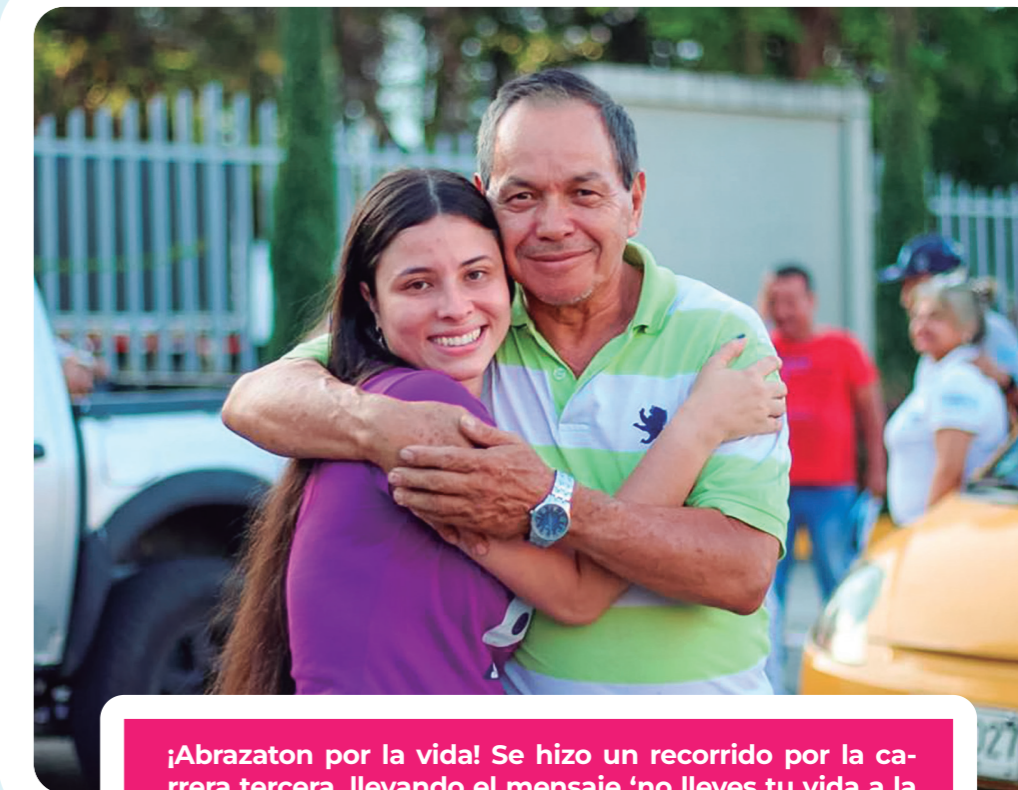
¡Abrazaton por la vida! Se hizo un recorrido por la carrera tercera, llevando el mensaje 'no lleves tu vida a la carrera, ponle freno cuando necesites una mano amiga', a todos los transeúntes que se encontraban en el sector.