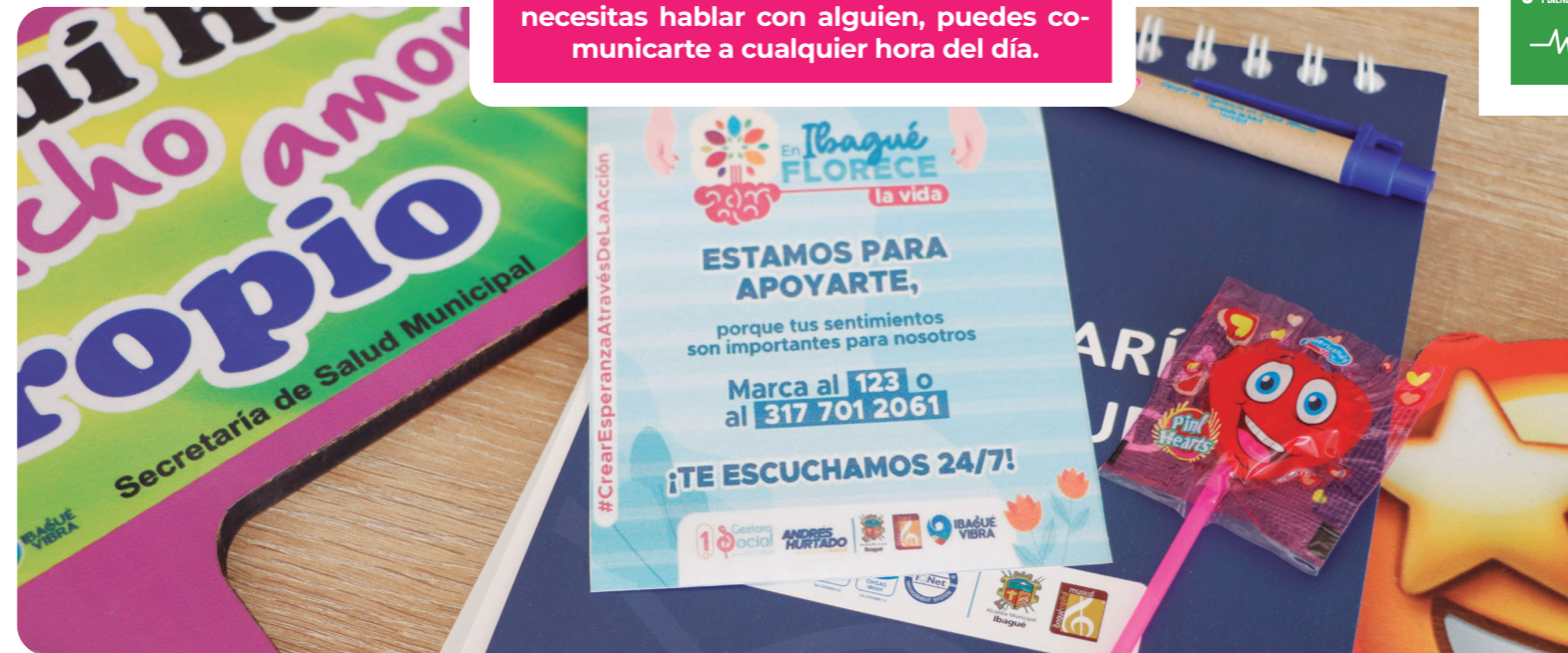
En las líneas de atención 123 y 317 701 2061 se han logrado atender 1.881 llamadas. Si necesitas hablar con alguien, puedes comunicarte a cualquier hora del día.