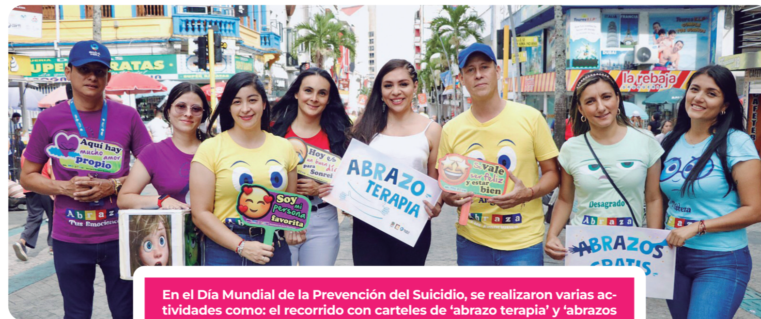
En el Día Mundial de la Prevención del Suicidio, se realizaron varias actividades como: el recorrido con carteles de 'abrazo terapia' y 'abrazos gratis' por la carrera tercera, con el objetivo de socializar el no estar bien, el pedir ayuda y ser una mano amiga cuando lo requiera.

tura de las estrategias, llegando a las zonas rurales y urbanas con capacitaciones y estrategias para una mente sana y tranquila. Estas son algunas de las acciones ejecutadas desde la Secretaría de Salud: