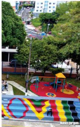
Nuevos juegos infantiles