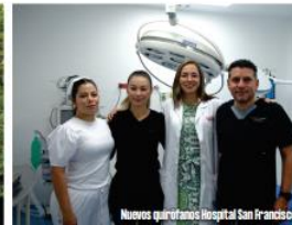
Nuevos quirófanos Hospital San Francisco