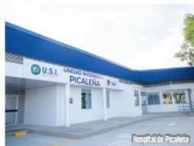
Hospital de Picalena