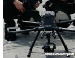
Sistema aéreo no tripulado