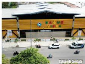
Colegio de Combate