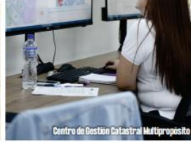
Centro de Gestión Catastral Multipropósito