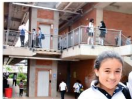
U.E. Francisco de Paula Santander