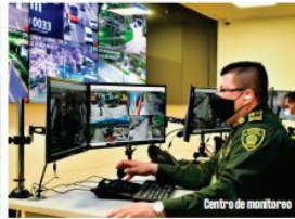
Centro de monitoreo