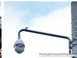
Nuevos sistemas de alumbrado público