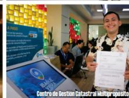
Centro de Gestión Catastral Multipropósito