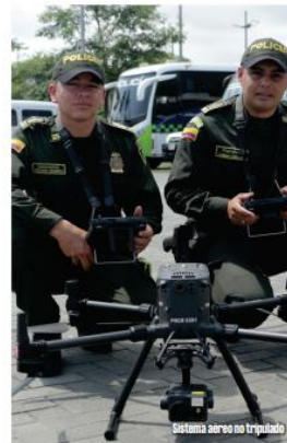
Sistema aéreo no tripulado