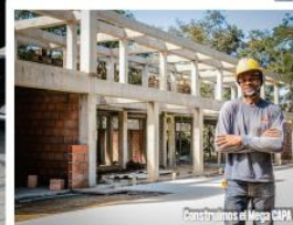
Construcción de Plaza CAPA