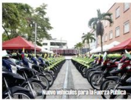
Nuevos vehículos para la Fuerza Pública