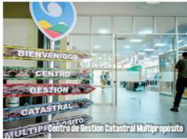
MULTIPROPOSITO Centro de Gestión Catastral Multipropósito