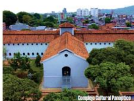
Complejo Cultural Paratopic