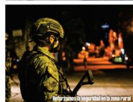
Reforzamos la seguridad en la zona rural