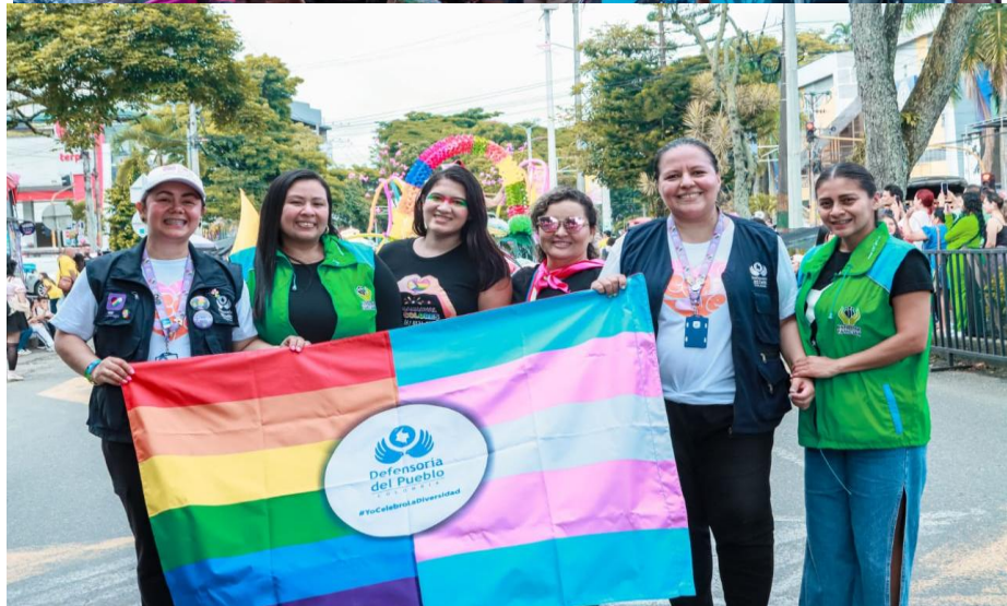
28 de junio 2024, Marcha del Orgullo Avenida 5ta