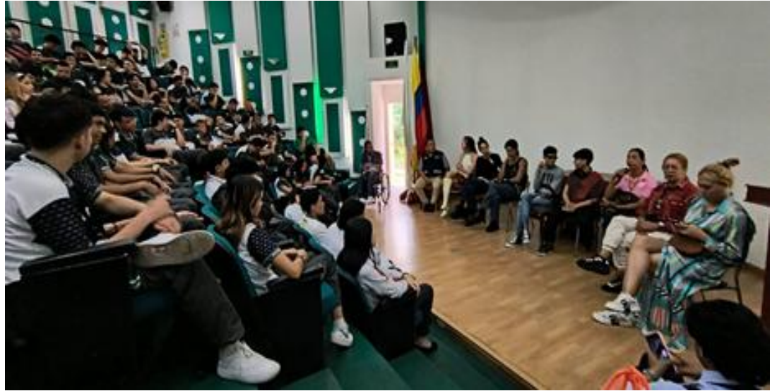
20 de junio 2024, Centro de comercio y servicios SENA

Desde el 2005, cada 17 de mayo se conmemora el Día Internacional contra la Homofobia, Transfobia y Bifobia, una jornada que busca visibilizar las diversas formas de discriminación y violencia que sufren las personas con orientaciones sexuales e identidades de género diversas (OSIGD). En Colombia, este día cobra una relevancia particular debido a la larga historia de violencia estructural y discriminación que ha afectado a estos sectores sociales en el país. A pesar de los avances legales, como la legalización del matrimonio igualitario en 2016 y la adopción por parte de parejas del mismo sexo, los prejuicios y la intolerancia persisten, especialmente en regiones donde los derechos y la inclusión son aún temas controversiales.