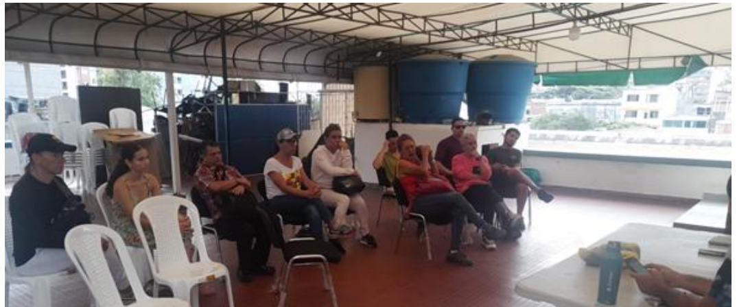
17 de junio 2024, Dirección de Juventudes

Por lo tanto, para la Dirección de la Mujer de la Alcaldía Municipal de Ibagué, es fundamental reconocer y visibilizar la lucha histórica por el restablecimiento de los derechos de las personas con orientaciones sexuales e identidades de género diversas (OSIGD) en nuestra ciudad. A través de esta iniciativa, la Alcaldía reafirma su compromiso con la igualdad, trabajando para garantizar que estos sectores sociales no solo sean reconocidos, sino también incluidas plenamente en todos los aspectos de la vida social y económica, promoviendo una Ibagué más justa e inclusiva.