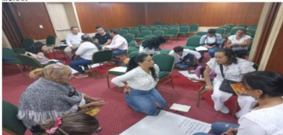
FOTO 2. DESARROLLO DEL TALLER PRACTICO FORMULACION DE UN PROYECTO