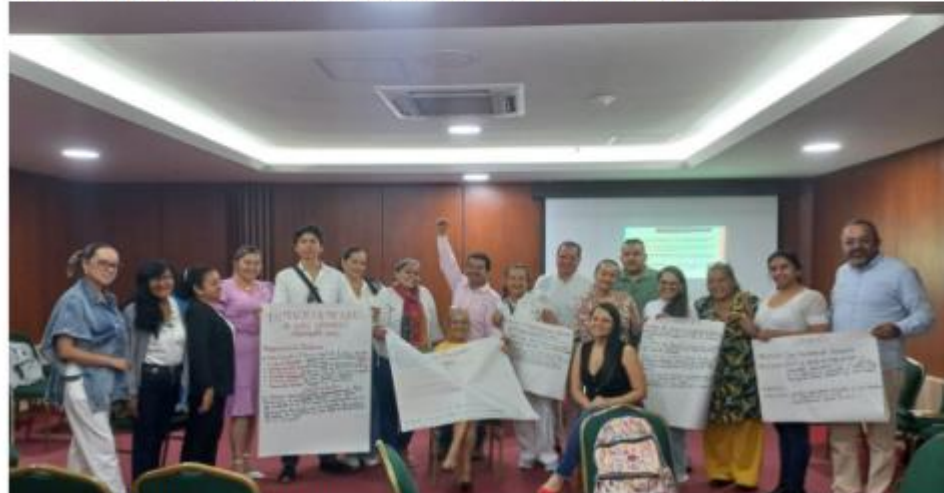
FOTO 4. CIERRE DE LA JORNADA