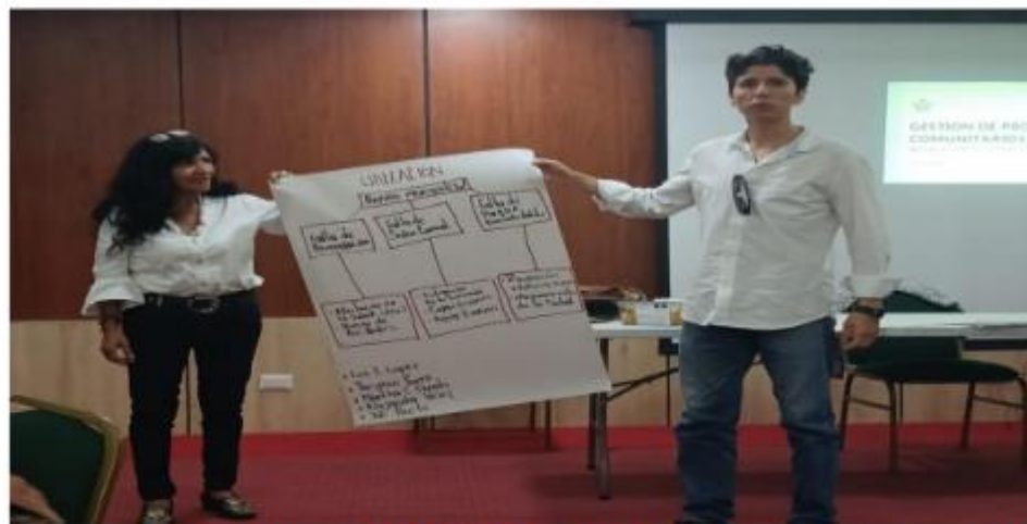
FOTO 3. DESARROLLO DEL TALLER PRACTICO FORMULACION DE UN PROYECTO POR PARTE DE LOS ASISTENTES DEL MUNICIPIO DE MARIQUITA