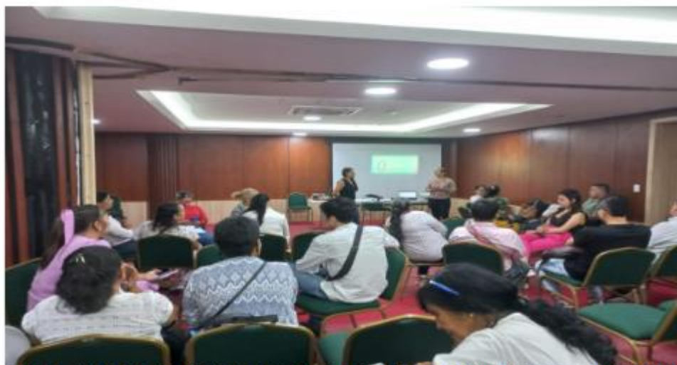
FOTO 1. INICIO DE LA CAPACITACION POR PARTE DE LA INSTRUCTORA, STEFANNY MORAN